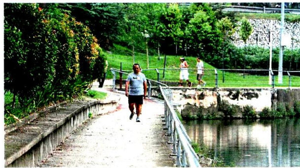
The public seen exercising at the Taman Jaya park in Petaling Jaya prior to the announcement of the closure notice by MBPJ.