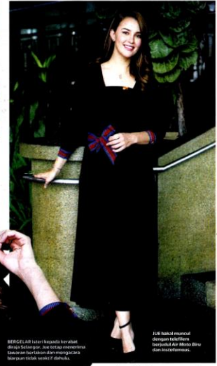
Jue telah memulakan dengan telefon bimbit di masa muda dan menggunakan Instagram.

ini memang sangat besar. "Jadi apabila diarah menjadi duta, memang teruja kerana berpeluang meneroka banyak lokasi yang tidak pernah saya kunjungi di Selangor," ujarnya. Katanya, setiap individu pasti memiliki sifat patriotik dan sayangkan negeri kelahiran mereka. "Perasaan teruja ini sebenarnya lebih kepada sifat patriotik yang nakar untuk dibuktikan secara fizikal. "Jadi dengan mandat yang diberikan, ini penting untuk saya memulakan hal-hal yang berkaitan dengan negeri. "Tugas ini sangat menarik untuk dapat melakukan promosi aktiviti di