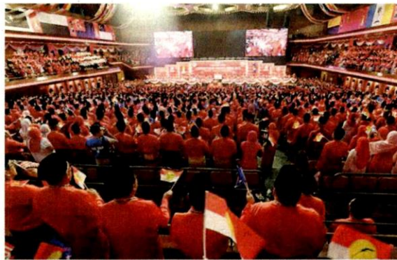
Proses menyegerakan pemilihan UMNO sebelum PRU15 membolehkan akar umbi menentukan hala tuju sebenar parti itu yang semakin bercelaru ketika ini.

Spekulasi itu secara tidak langsung menyebabkan perpecahan dalam parti itu dilihat semakin kritikal.