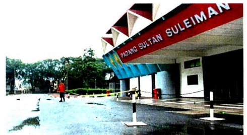
Yesterday, only a handful of people turned up to exercise at Stadium Sultan Suleiman in Klang.

On Monday, the Prime Minister announced that Selangor along with five other states would be put under the movement control order for two weeks until Jan 26.