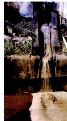
KESAN bulh sisa Industri berasaskan bahan kimia di sebuah kilang di Shah Alam yang mengalir terus ke longkang.

Katanya, semua kegiatan itu dilakukan pada waktu malam