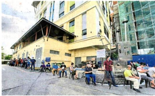
■会 到加影市议会大厦办理事务的人群，已惊动市议