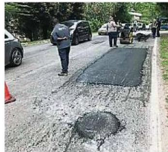
加影市議會管轄區內有不少路洞。